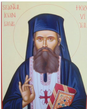
Sfantul Ioan Iacob de la Neamt (Hozevitul)

You need not be despondent. Let those be despondent who do not believe in God. For them sorrow is burdensome, of course, because besides earthly enjoyment they have nothing. But believers must not be despondent, for through sorrows they receive the right of sonship, without which is impossible to enter the Kingdom of Heaven. (+ St. Barsanuphius of Optina)